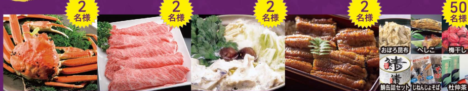
越前がに 三ツ星若狭牛 若狭ぶぐ鍋セット うなぎの蒲焼き 若狭路特産品