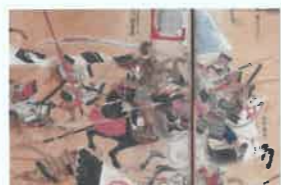
「姉川合戦図屏風」当館蔵