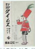
「少女歌劇タイムス」当館蔵