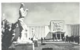
「福井復興博覧会会場」当館蔵