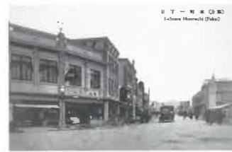
「(福井) 本町一丁目」