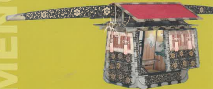
「水津村の伝統的行事 浮舟祭」 （福井県大野郡大野町）