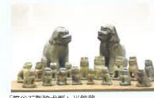
「笏谷石製狛犬群」当館蔵

そのほかのイベント 5月、8月には、サポーターズクラブによる家族で楽しめる体験イベント実施! 詳しい日時や内容は、ホームページやツイッターをご覧ください。