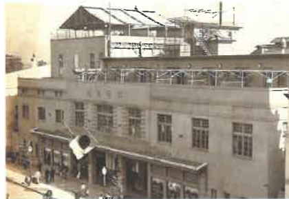
「だるま屋の外観」個人蔵

明治時代以降、大都市で誕生した百貨店は、その後、全国各地に つくられていきます。百貨店は、ただ買い物をするための場所では なく、都市の文化や娯楽を象徴する場所でした。この展示では、 日本と福井の百貨店の歴史をふり返り、百貨店と人びととのつな がりの歴史を考えます。