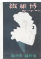
福井復興博覧会 「福井復興博覧会 ポスター」複製、 当館蔵