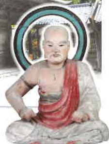
五百羅漢坐像 康傳作（江戸時代）（永平寺蔵）