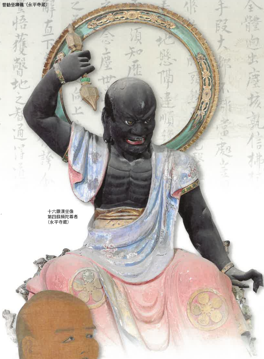
十六羅漢坐像 第四蘇頻陀尊者 (永平寺蔵)