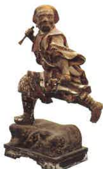
伽藍神立像 監齋使者（鎌倉時代）（永平寺蔵）

〔開館時間〕9時から17時まで（入館は16時30分まで）〔休館日〕10月16日（水） 〔観覧料〕一般400(320)円、高校・大学生300(240)円、小中学生・70歳以上の方は200(160)円