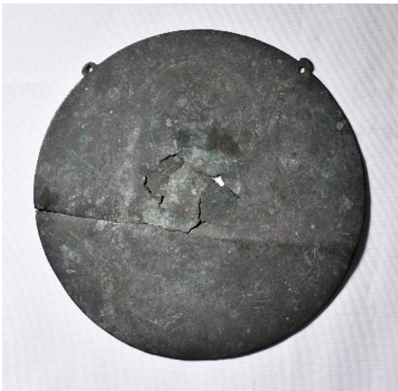
① 線刻観音菩薩懸仏

6面のうち①②は鏡面に尊像を線刻し、③④⑤は鏡板に打出し像を取り付ける。⑥鏡板に尊像などの意匠 のみ を鑿で打出す。附指定の3面は、現状では尊像が失われている。①は県内に残る懸仏では最古のものであり、②～⑥とあわせて地域で代々伝わってきた信仰の様子がうかがえる貴重な作例である。