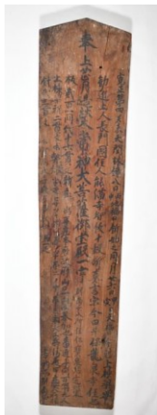
寛正四年常神大菩薩御宝殿上葺棟札

なお、当社に残る木札は、多くが棟札であるが、なかには「 ごまふだ 護摩札」などと呼称するほうが相応しい木札も見られるため、名称は「常神社棟札類」とした。また、戦後の棟札も存在するが、一貫して保管され伝来したものであるため、一括して取り扱う。